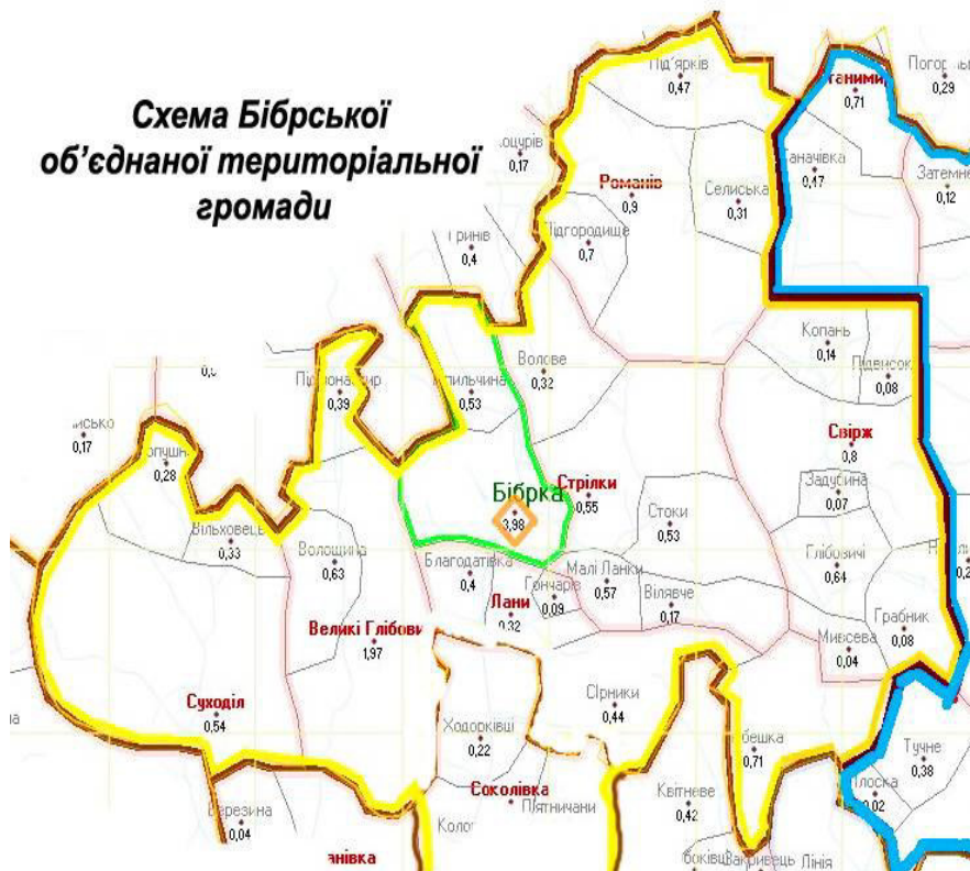
Схема Бібрської об'єднаної територіальної громади

Львівська обласна державна адміністрація та Офіс реформ запропонували створити на території Перемисьлянського району дві спроможні громади – Перемисьлянську та Бібрську.